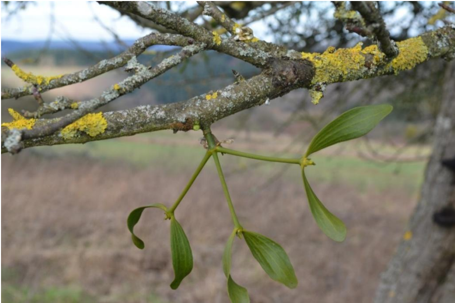
Abb. 2: 4-jährige Mistel im Wirtsholz eines Apfelbaums