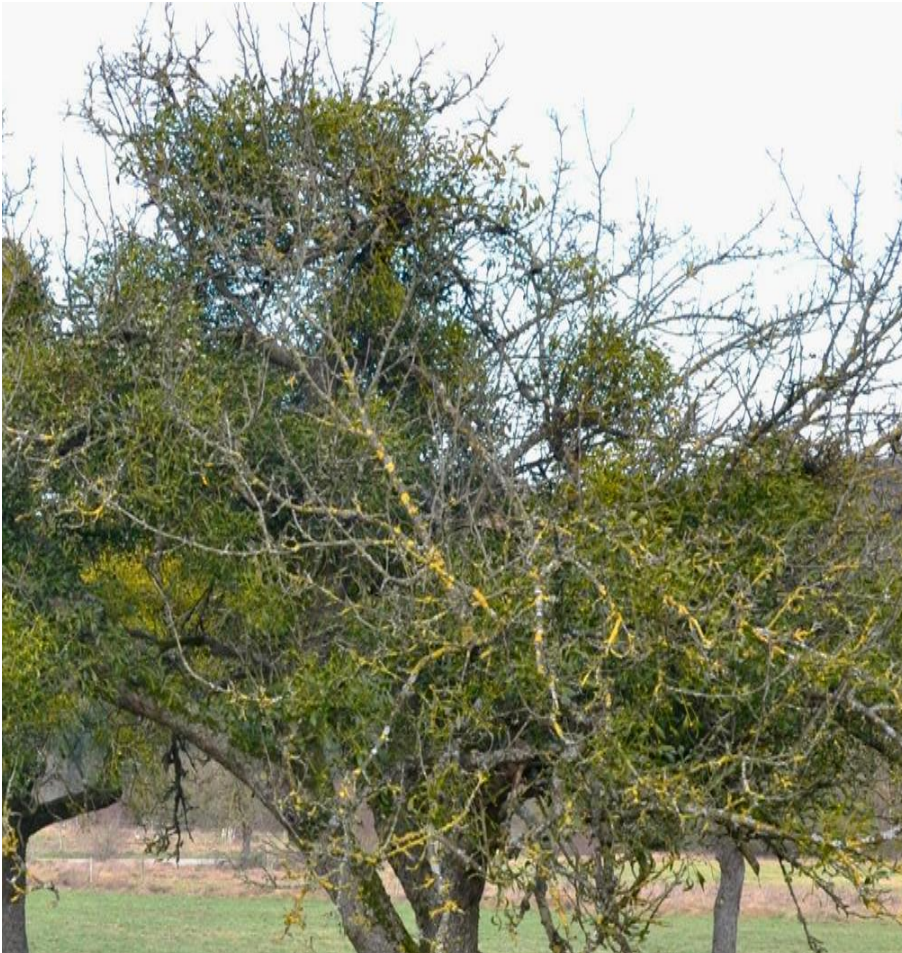
Abb.4: Der hohe Befall des Wirtsbaumes mit Misteln führt zum Absterben einzelner Astpartien, auch die Mistelpflanze stirbt dabei ab

An inneren Astpartien (Leitäste, Stammverlängerung), bleibt als Notmaßnahme nur die Möglichkeit, die Misteln abzubrechen (am besten brechen sie bei Frost) oder sie abzuschneiden. Dadurch lässt sich allerdings nur die weitere Ausbreitung durch Früchte (Scheinbeeren) verhindern. Die Saugwurzeln selbst mit ihrem Mistelsenkergewebe verbleiben auf bzw. im Baum. Die Mistel benötigt dann etwa vier Jahre, bis sie wieder Samen produziert. Der Wirtsbaum wird vorübergehend entlastet.