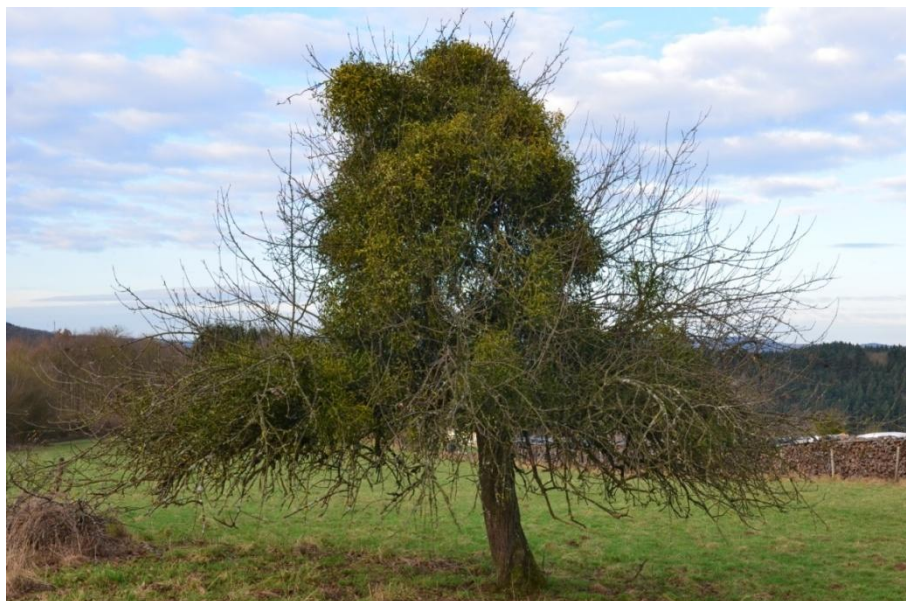
Abb. 1: Von Misteln stark befallener Apfel-Hochstamm

Die Kombination von hoher Obstsortenvielfalt und Artenreichtum führt dazu, dass größere Streuobstbestände "Hotspots der biologischen Vielfalt" sind und als "Biodiversitätszentren" bezeichnet werden, für die insbesondere Deutschland eine internationale Verantwortung besitzt.